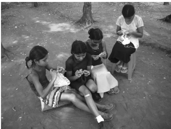
Grupo de tejidos organizado y enseñado por una promotora adolescente