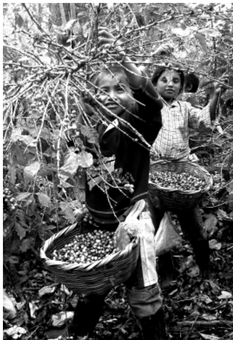
Niños y niñas cortando café en Hacienda La Isla.

Uno de los graves problemas de este sistema es que obstaculiza el ejercicio del derecho a la educación. Miles de niños y niñas salen de las aulas a fines de octubre sin completar su año escolar. Al regresar a la escuela en febrero, ya han perdido el inicio del próximo año y deben repetir el año que ya estudiaron. Así que el trabajo infantil es el principal factor causal en las altas tasas de deserción escolar