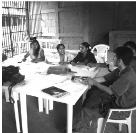
Reunión del Equipo Territorial, La Dalia.

CESESMA promueve procesos de auto-organización de niños, niñas y adolescentes, la