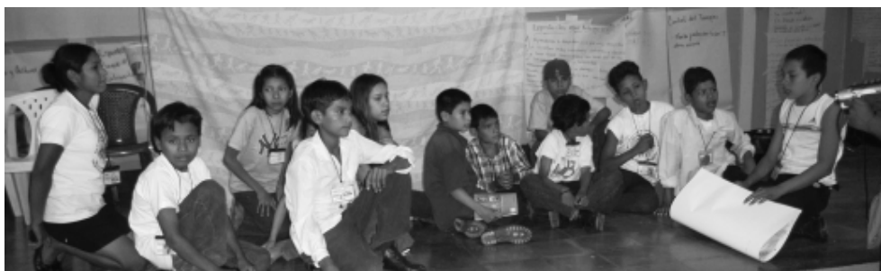
Promotores y promotoras participan de un intercambio interorganizacional sobre participación en Estelí.

Uno de los mayores retos que tienen las personas adultas que pretenden facilitar los procesos de participación que no son tokenísticos, más allá del nivel de familia, escuela y pequeños proyectos locales de poco alcance, es asegurar que los niños, niñas y adolescentes no sean manipulados/as para servir a las agendas de los adultos. La experiencia de CESESMA sugiere que una manera para lograr esto es apoyar los procesos graduales de los niños y niñas desde abajo; aprendiendo, com-