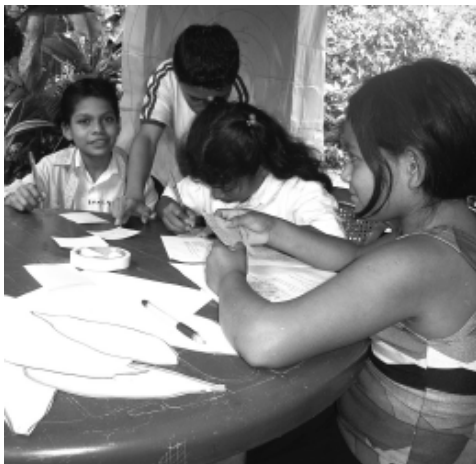
Niños y niñas participan con CESESMA en la evaluación de fin de año. La Grecia, Yasica Sur.

Un promotor o una promotora es educador/a, organizador/a y activista, y para muchos de ellos/as, el énfasis está en el rol de educador/a comunitario/a. Los adolescentes conforman y animan los grupos de interés, compartiendo sus conocimientos y habilidades con otros, lo que produce lo que llamamos “el efecto multiplicador”. En este sentido, la