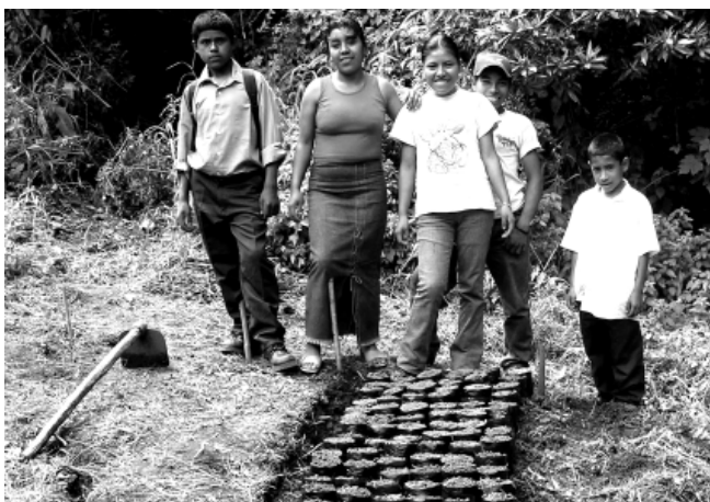
Grupo ambientalista preparando plantas para un proyecto de reforestación.

La escuela formal generalmente dicta clases sólo por las mañanas. Aunque la mayoría de los niños y niñas trabajan en las fincas, en las parcelas familiares, realizando trabajo doméstico o en las tres cosas, generalmente logran organizar su tiempo para poder participar de las actividades que más les interesan. Todas las actividades son gratuitas, y toda participación es voluntaria. No se hace publicidad porque las comunidades rurales son pequeñas, y la información circula de boca en boca. Los niños y niñas que se integran a estos grupos de interés y asisten regularmente adquieren nuevas habilidades, forman amistades y aumentan su confianza y autoestima. Muchas veces también se percibe que mejora su rendimiento escolar.